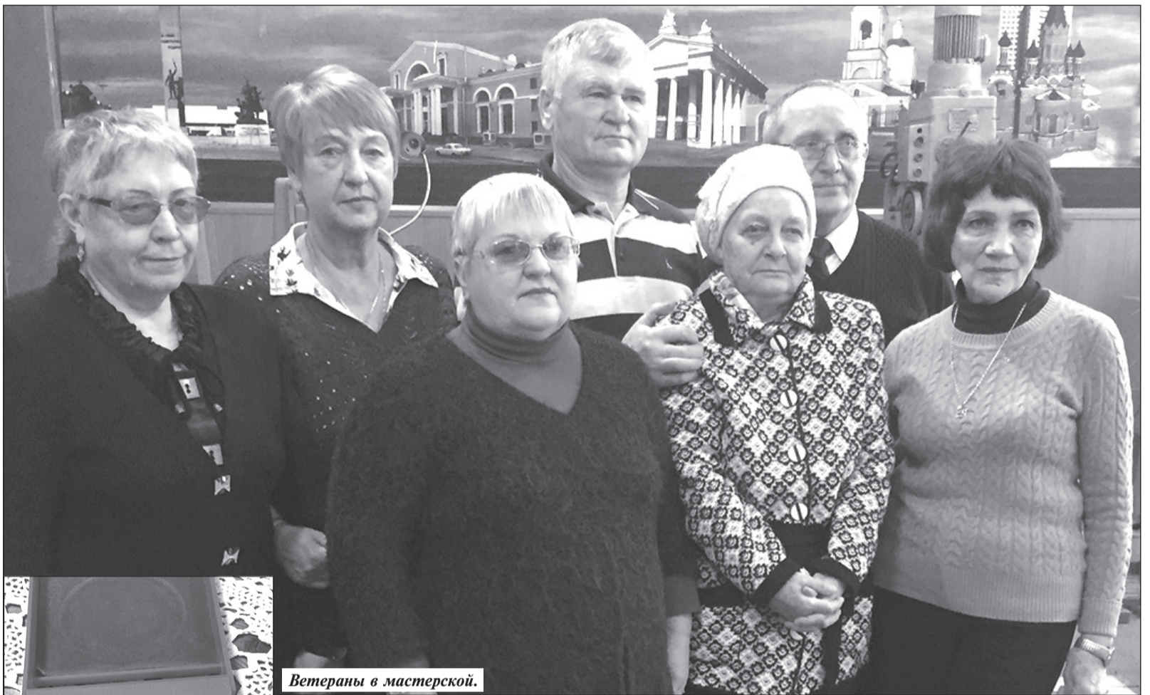
Ветераны в мастерской.