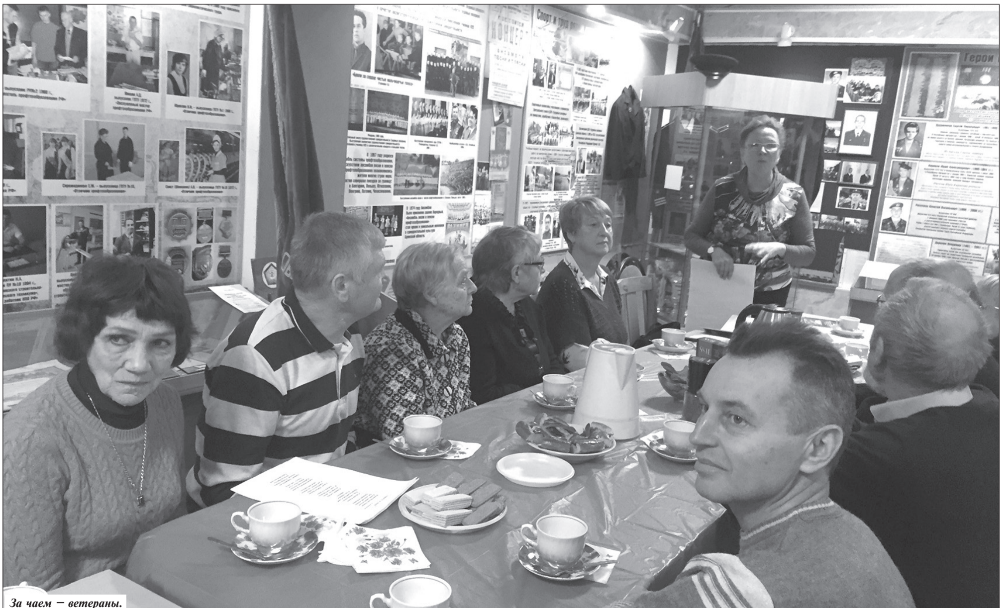
За чаем — ветераны.